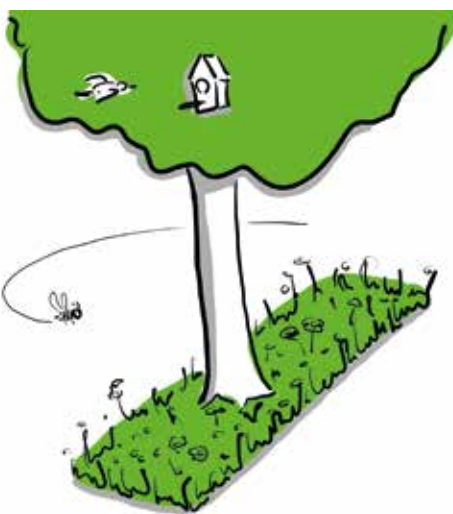
Bomen in de straat.

In veel vooroorlogse Haagse wijken is weinig ruimte voor groen en spelen. Verharding en auto's domineren het straatbeeld. Veel bewoners zijn daar klaar mee en willen meer ruimte voor andere